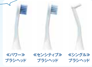
《パワー》ブラシヘッド 《センシティブ》ブラシヘッド 《シングル》ブラシヘッド